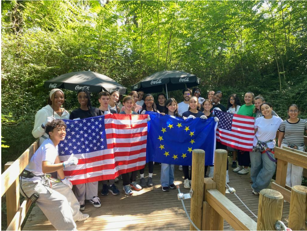
Journée d'intégration avec activité accrobranche