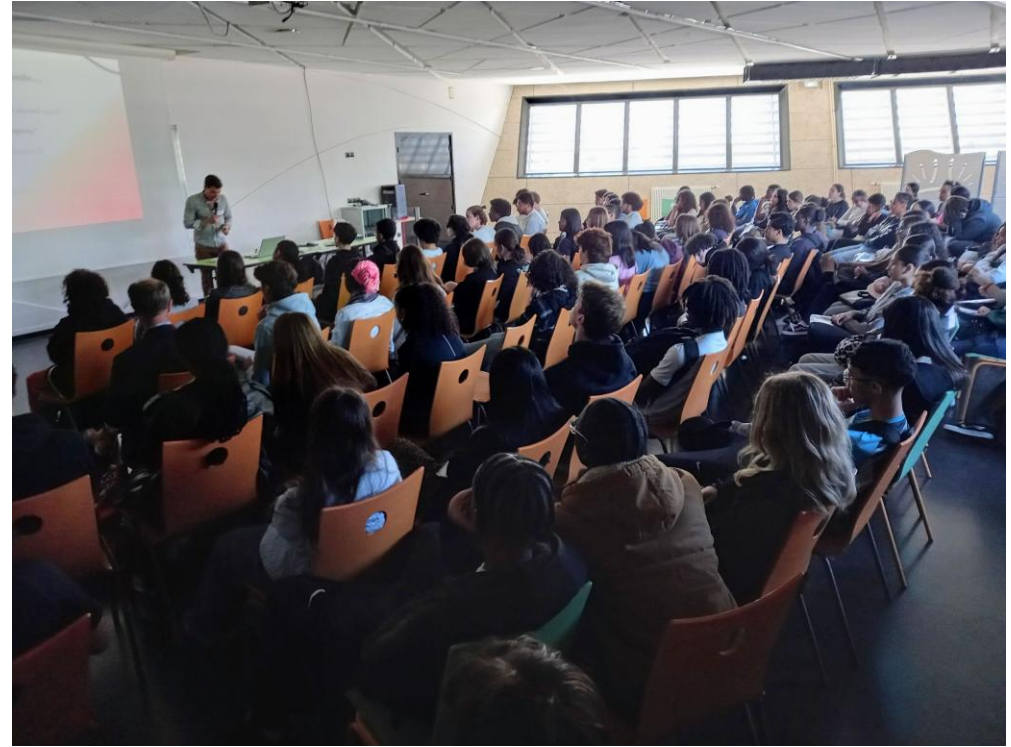
Master class avec des universitaires spécialisés