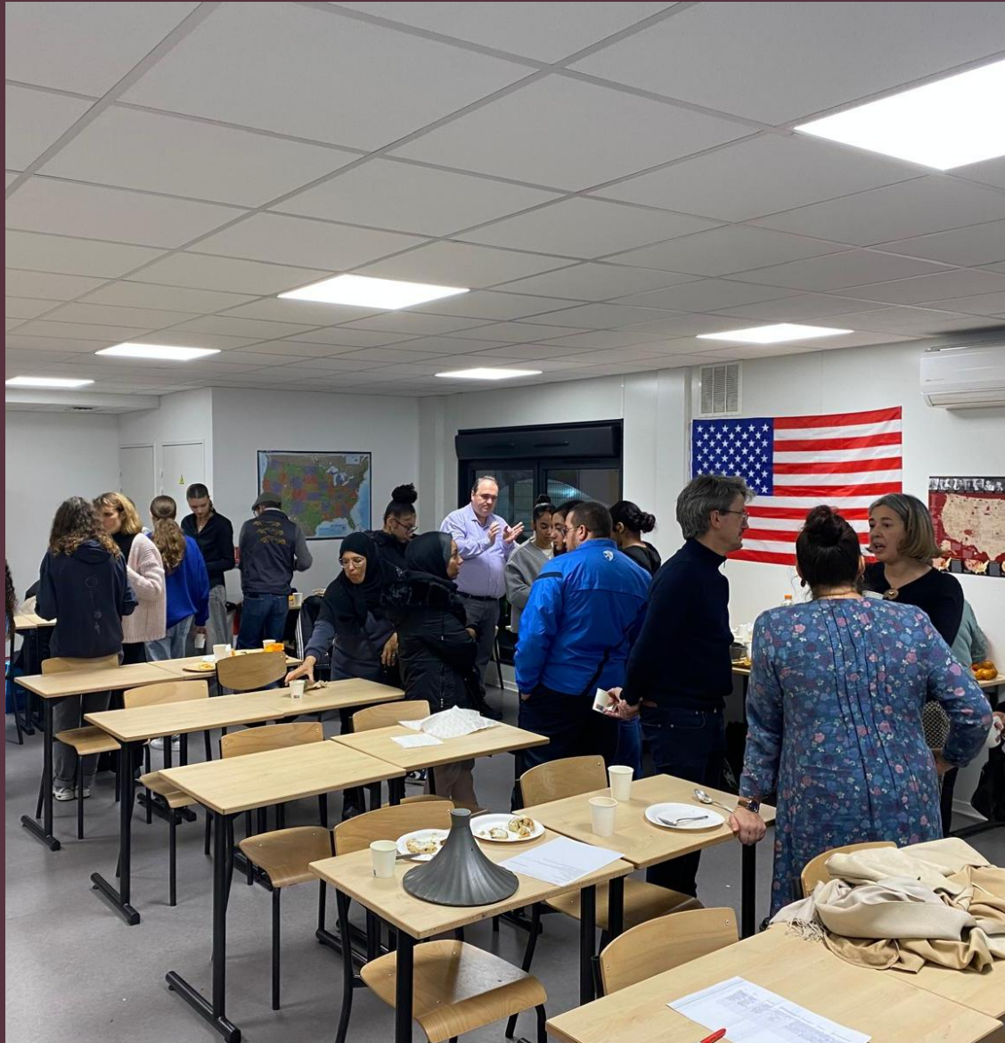
Repas de Thanksgiving au Lycée Faÿs !