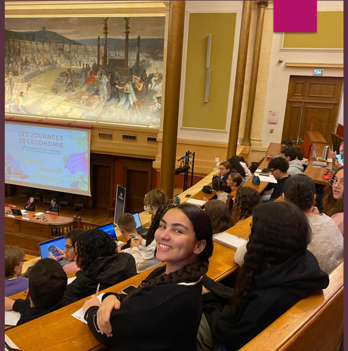
Invitation au JECO à l'Université Lyon II